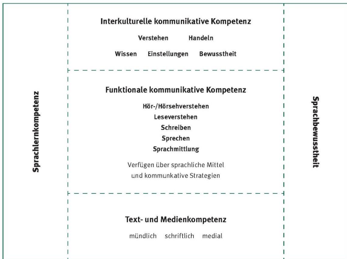
Kompetenzmodell der Bildungsstandards 1

Alle abgebildeten Kompetenzen stehen in engem Bezug zueinander. Dies wird durch die unterbrochenen Linien verdeutlicht. Interkulturelle Kompetenz manifestiert sich in fremdsprachlichem Verstehen und Handeln. Aus diesem Grund wird sie als interkulturelle kommunikative Kompetenz bezeichnet. Ihre Dimensionen sind Wissen, Einstellungen und Bewusstheit.