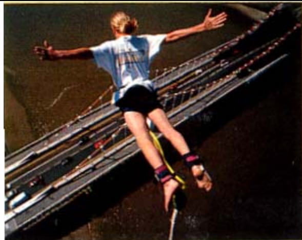
5. Bungee jumping