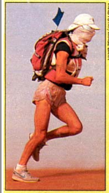
1. Maratona estrema