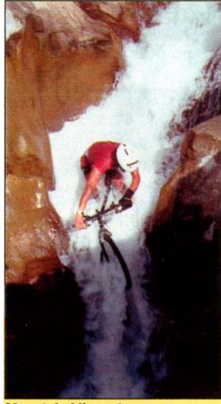
2. Mountain bike downhill